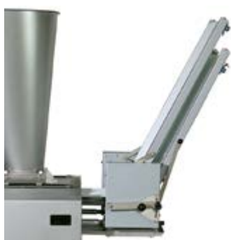
Optionele hoog transportband; voor het transporteren van deegstukken naar een hoogte van max 165 cm.