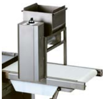
Automatische RVS meelstrooier met continue of interval bestrooiing van afgewogen deegstukken (optie).

met uniek vacuüm doseringssysteem voor drukloos afwegen zonder olie