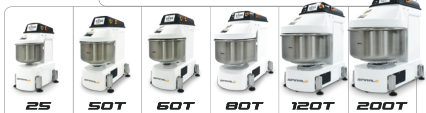
25 50T 60T 80T 120T 200T