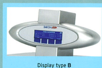
Display type B