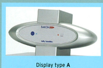
Display type A